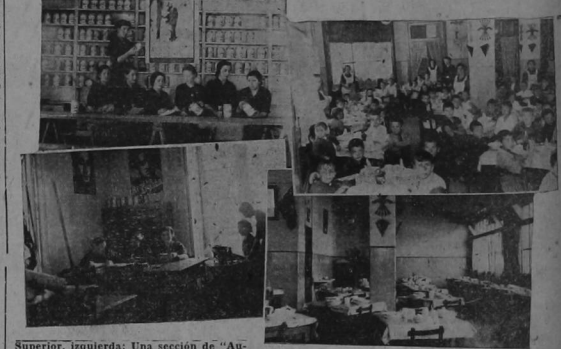
Superior, izquierda: Una sección de "Auxilio Social" de Zaragoza. Derecha: un comedor de los muchos que Falange Española tiene en servicio. Inferior, izquierda: desde hoy de administración de uno de los comedores. Derecha: otro aspecto del otro de los comedores de niños de "Auxilio Social"

COMO PRORRUMPIERON EN GRITOS DE: ¡VIVA COSTA RICA! LOS NIÑOS DE UN COMEDOR DE "AUXILIO SOCIAL" AL ENTRARSE DE QUE, DESDE AQUI, SE LES HABIA ENVIADO VARIOS DONATIVOS