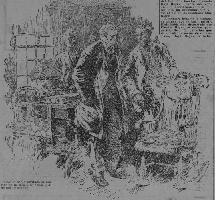
Hoy lo habia invitado al interior de la casa y lo habia pedido que se sentara.

(Por CLARA CARVALHO, EXCLUSIVO PARA "LA TRIBUNA")